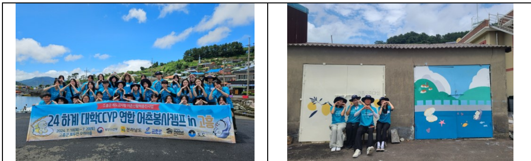
▲연합 캠프 (in 고흥)

해비타트 특별활동은 매년 구성이 변경될 수 있다. 주된 활동 종류로 유스빌더(주거환경개선 봉사활동), CCYP 연합캠프(봉사캠프) 등이 있다.